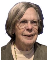
Bijdrage Kay Curfs-H.

Aanmelden uiterlijk op de woensdag voorafgaand aan de activiteit (tenzij anders aangegeven) door het strookje onder aan de nieuwsbrief in te vullen en met het geld in te leveren bij: